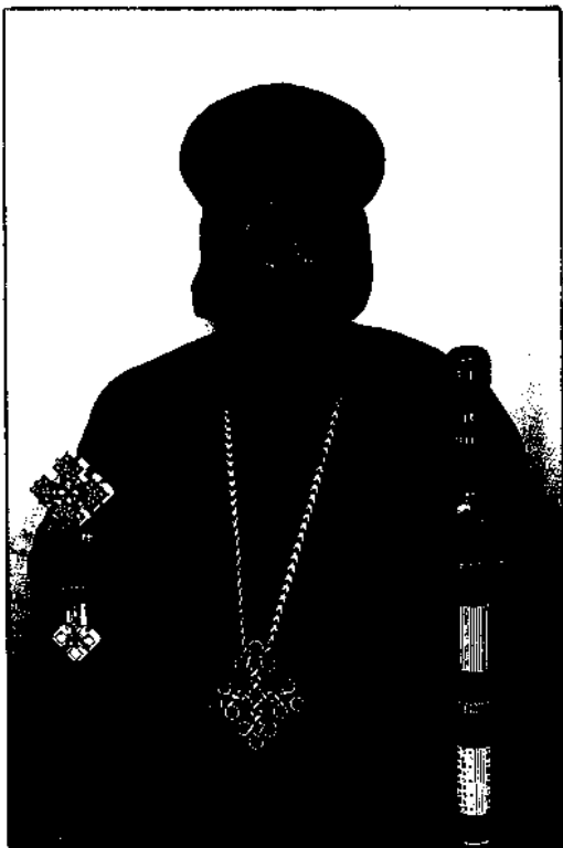
نيافة الأنبا صموئيل أسقف شبين القناطر وتوابعها